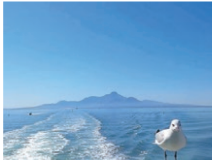
2023年3月最後の八代⇄諫早往復をカモメとともに思いふける(笑)