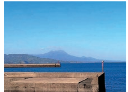
鬼池港からの雲仙普賢岳