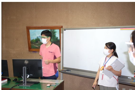
職員で分担して離設者を検索。