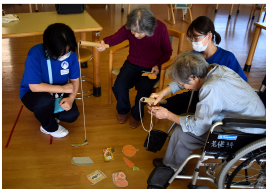
担当の利用者様と釣りゲームを楽しみました

居宅介護支援事業所では、介護支援専門員に同行し、実際に利用者様宅への訪問や、担当者会議に参加させてい